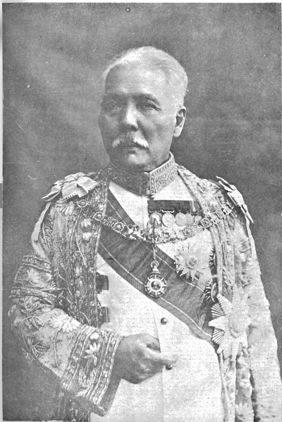
พระวรวงศ์เธอ พระองค์เจ้าพร้อมพงศ์อิราข