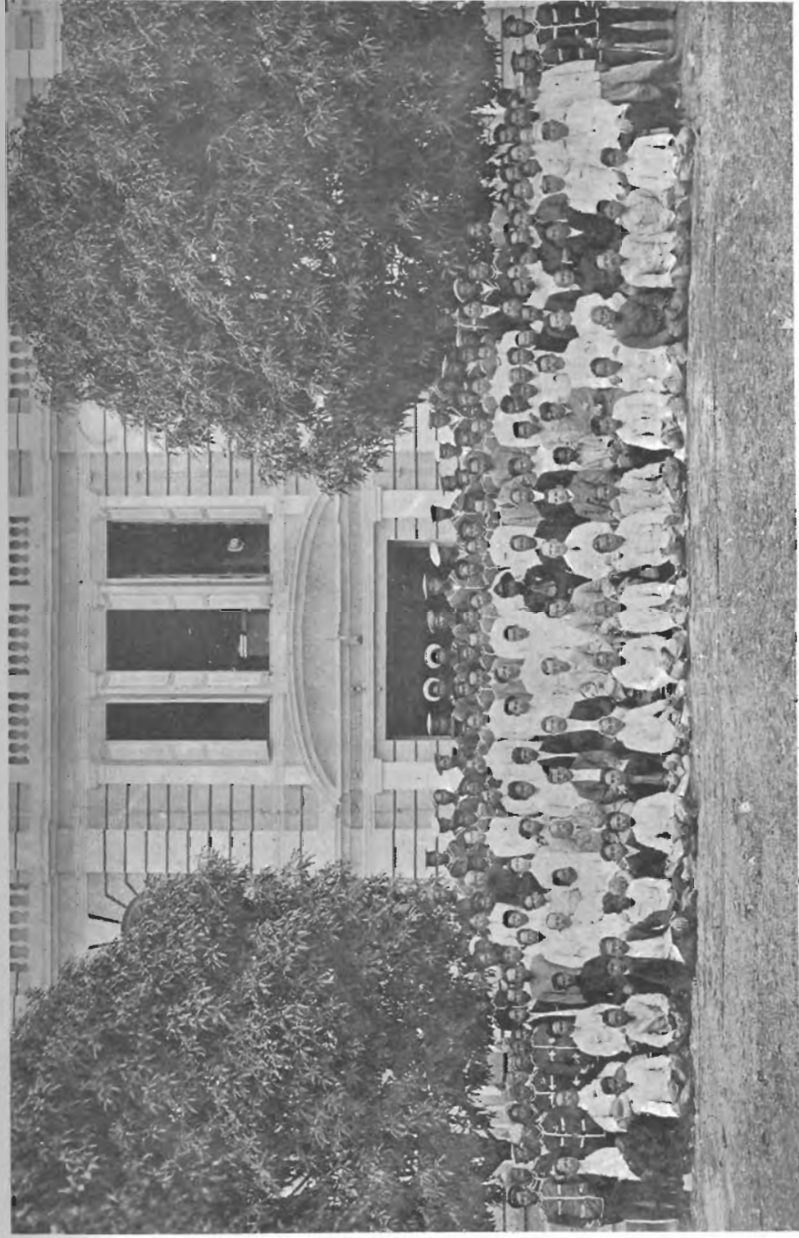
ข้าราชการกรมศึกษาธิการ เมื่อราว พ.ศ. ๒๔๕๓